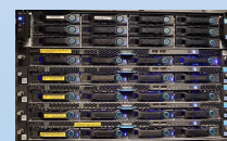
User Plane Function (Gateway)